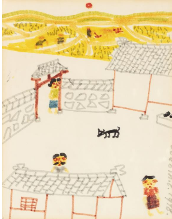
장욱진, 마을, 1978, 캔버스에 유채, 20 x 15 cm