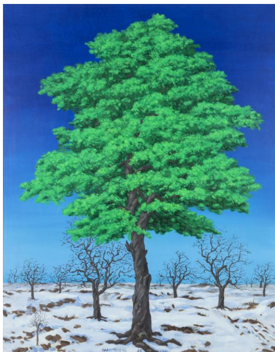
LIM Oksang, Evergreen , 1983, Oil on canvas, 190 x 160 cm