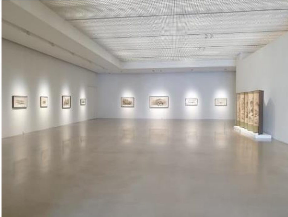
Installation view of Unexpected Time in Hometown © ARTIST and Arario Gallery