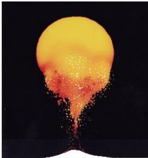
황규태, Melting the Sun , 1993, R-Print, 200 x 133 cm