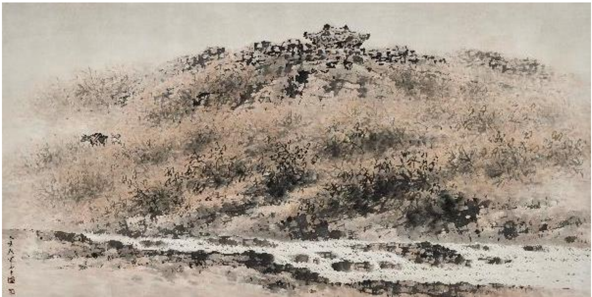
청전 이상범, 추경산수, 수목담채, 64 x 134 cm