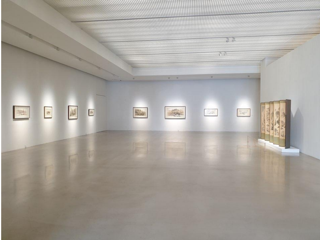
Installation view of Unexpected Time in Hometown