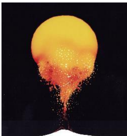
HWANG Gyutae, Melting the Sun , 1993, R-Print, 200 x 133 cm