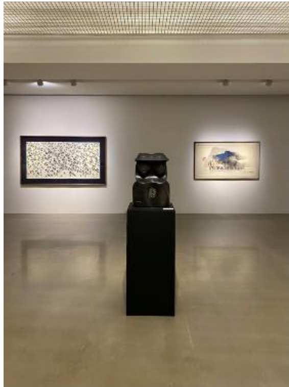
Installation view of Unexpected Time in Hometown at ARARIO GALLERY | Cheonan, 2020